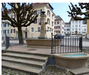
Le Locle - Le Quartier-Neuf