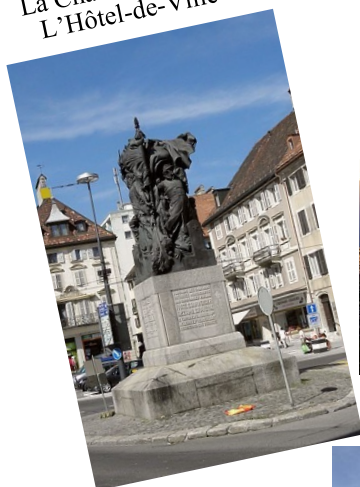
La Chaux-de-Fonds L'Hôtel-de-Ville

Périodique trimestriel de l'Association suisse de défense et de détente des retraités Edité par les sections du canton de Neuchâtel et Interjurassienne Case postale 1749 - 2001 Neuchâtel