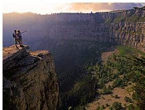
La Chaux-de-Fonds La Synagogue