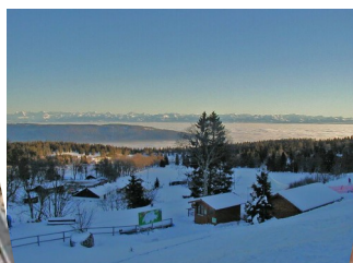
La Vue des Alpes