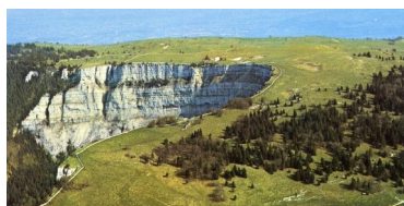
Le Creux du Van