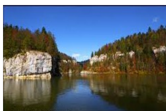
Les Brenets - Le Doubs

Périodique trimestriel de l'Association suisse de défense et de détente des retraités Edité par les sections du canton de Neuchâtel et Interjurassienne Case postale 1749 - 2001 Neuchâtel