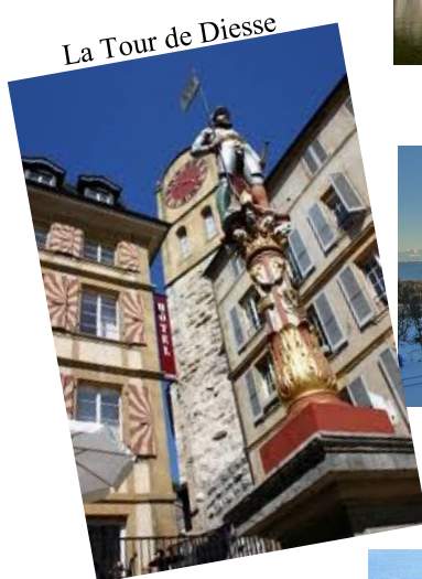
La Tour de Diesse