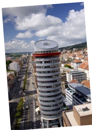
La Chaux-de-Fonds Espace

Périodique trimestriel de l'Association suisse de défense et de détente des retraités édité par les sections du canton de Neuchâtel Case postale 1749 - 2001 Neuchâtel