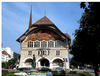
Le Locle - Hôtel de Ville