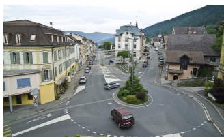
Neuchâtel Le Château