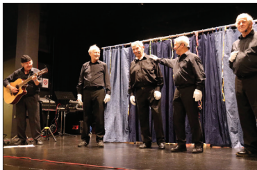
L'équipe au complet