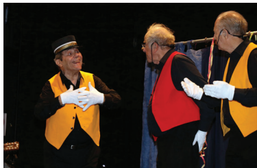
Dans le feu de l'action!

Animation récréative par les Copains d'Alors.