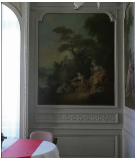
Villa Mon Rêve abritant La Chrysalide, hôpital de soins palliatifs – Salle à manger des résidents.