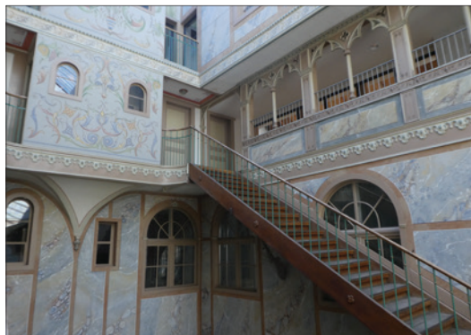
Escalier de l'espace intérieur du bâtiment de deux étages et des combles de l'Ancien Manège.