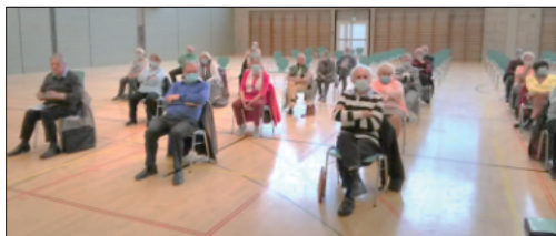
En respectant les restrictions en vigueur !

Approuvé à l'unanimité par l'assemblée, le comité et les vérificateurs de compte sont confirmés :