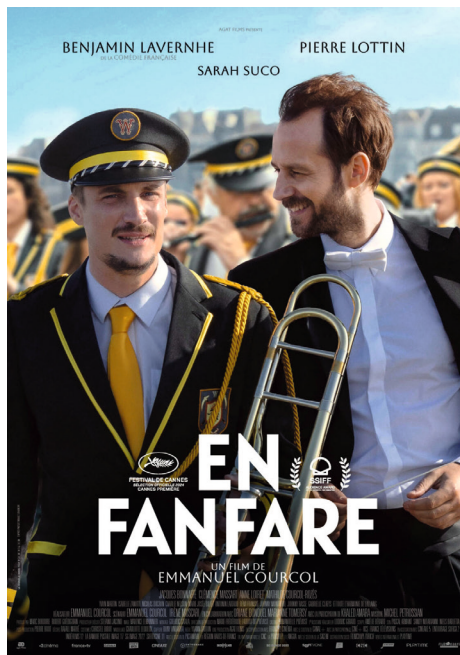
L'affiche du film