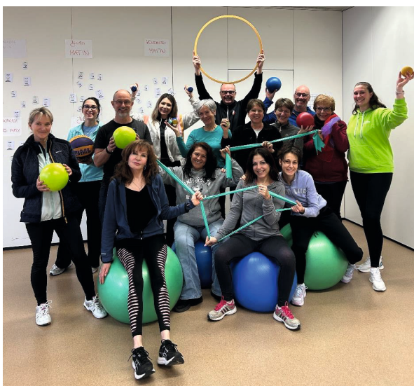
De nouveaux moniteurs et monitrices lors de l'une de nos formations

Vous avez le contact facile et aimez bouger ? Alors rejoignez notre équipe de monitrices et de moniteurs pour accompagner des seniors dans des activités sportives et de loisirs ! Vous recevrez une formation certifiée et un défraiement pour votre engagement.