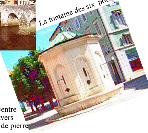
Au centre Travers Le Pont de pierre