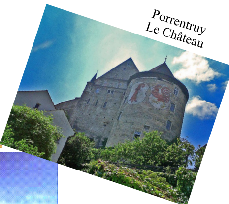
Porrentruy Le Château