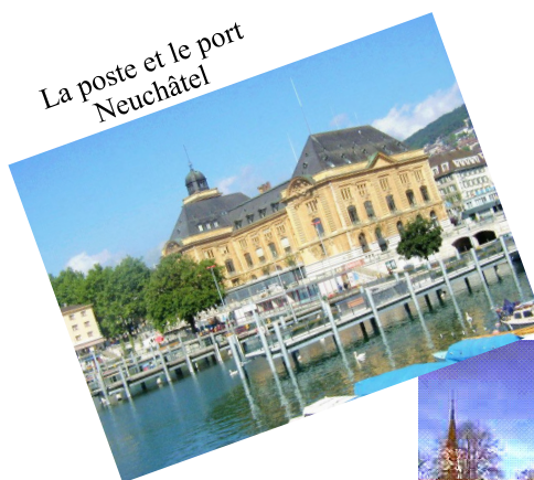
La poste et le port Neuchâtel