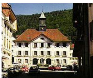
Moutier - Hôtel de Ville La Chaux-de-Fonds Fontaine monumentale