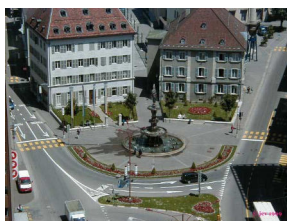
Neuchâtel Hôtel du Peyrou