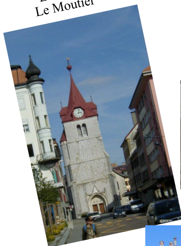
Le Locle Le Moutier

Périodique trimestriel de l'Association suisse de défense des rentiers et préretraités Edité par les sections du canton de Neuchâtel et Interjurassienne Case postale 1749 - 2001 Neuchâtel