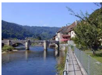
Jura - St-Ursanne