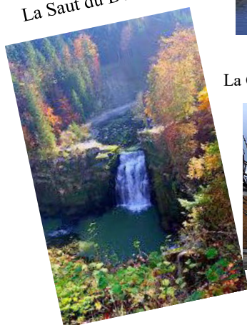
Les Brenets La Saut du Doubs

Périodique trimestriel de l'Association suisse de défense des rentiers et préretraités Edité par les sections du canton de Neuchâtel et Interjurassienne Case postale 1749 - 2001 Neuchâtel