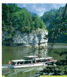
Les Brenets - Le Lac Promenade à cheval Jura